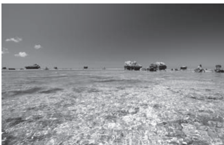
表紙の写真：宮古島、保良の海岸