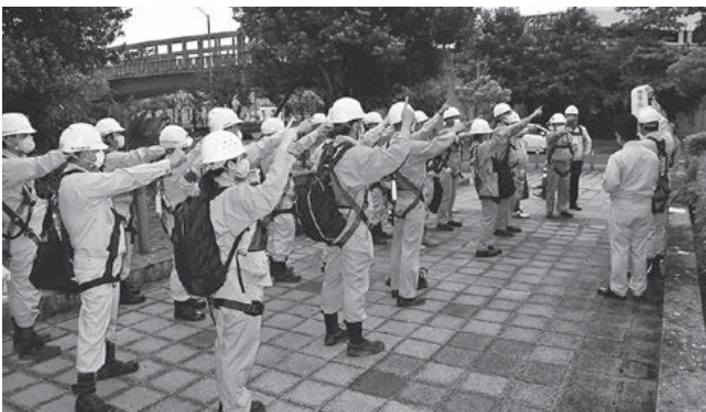
那覇労働基準監督署管内 (那覇分会、南部分会、浦添・西原分会)