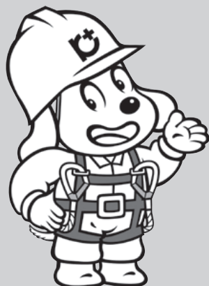
建災防キャラクター「ホッピーくん」