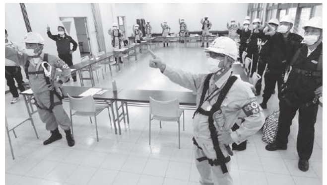
沖縄労働基準監督署管内 (中部分会)