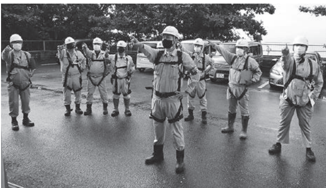
八重山労働基準監督署管内 (八重山分会)