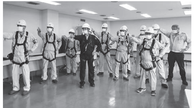
宮古労働基準監督署管内 (宮古分会)