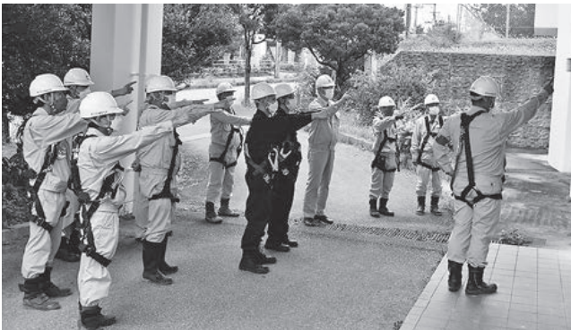
北部労働基準監督署管内 (北部分会)